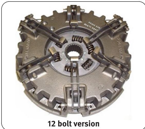
12 bolt version

Cette nouvelle conception utilise la dernière technologie d'embrayage, en utilisant un boîtier ventilé pour améliorer le refroidissement et la dispersion de la chaleur. Entièrement interchangeable avec les embrayages de fixation à 12 boulons existants, sans modification du véhicule ou du volant d'inertie. Utilisez les 6 boulons de fixation existants.